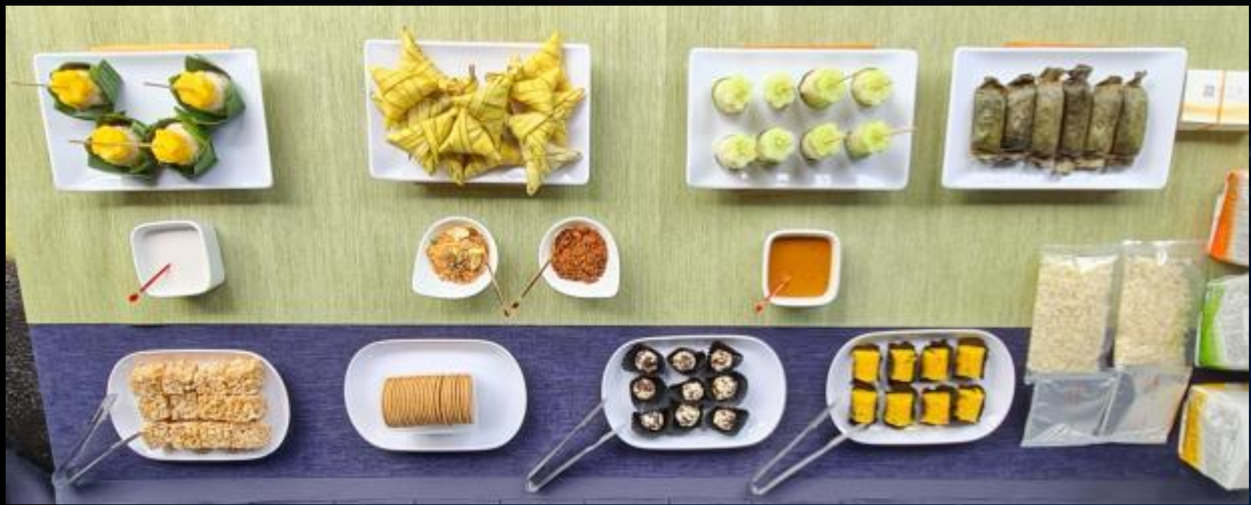
攝影者：鄭百宏（惟信）