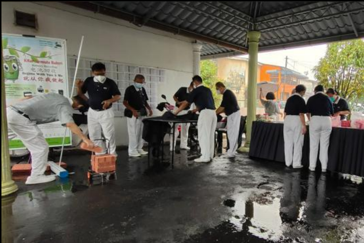
攝影者：黃樹韻（慮茗）